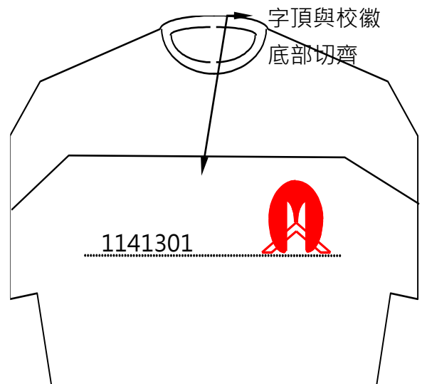
圖 b (無口袋)